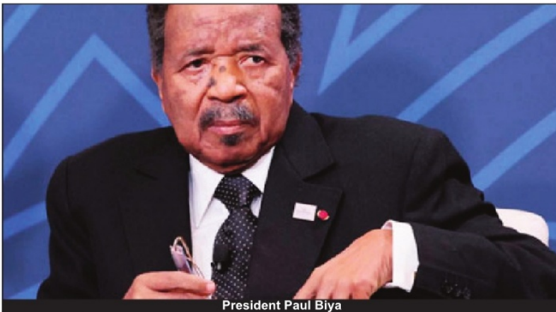
President Paul Biya