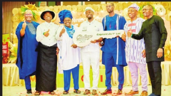
Various stakeholders at Nestlé Cameroun's 2026 Business