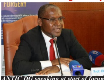
ANTIC DG speaking at start of forum